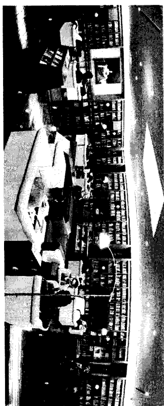
熊本市現代美術館